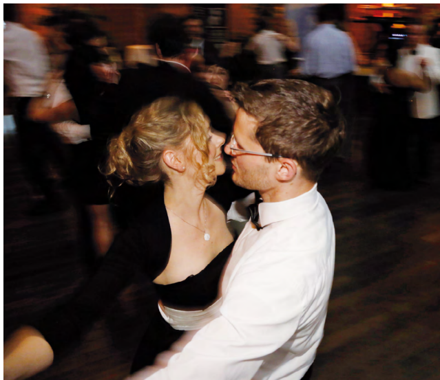
Tanzen, Spielen, Feiern – ist erneut das Motto von Alumni-Ball der Goethe-Universität.