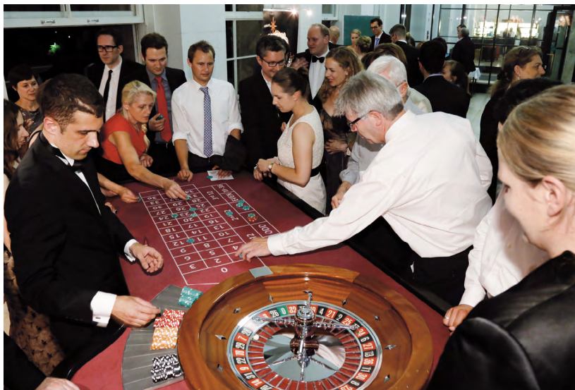
2013 war der Roulette-Tisch sehr begehrt.