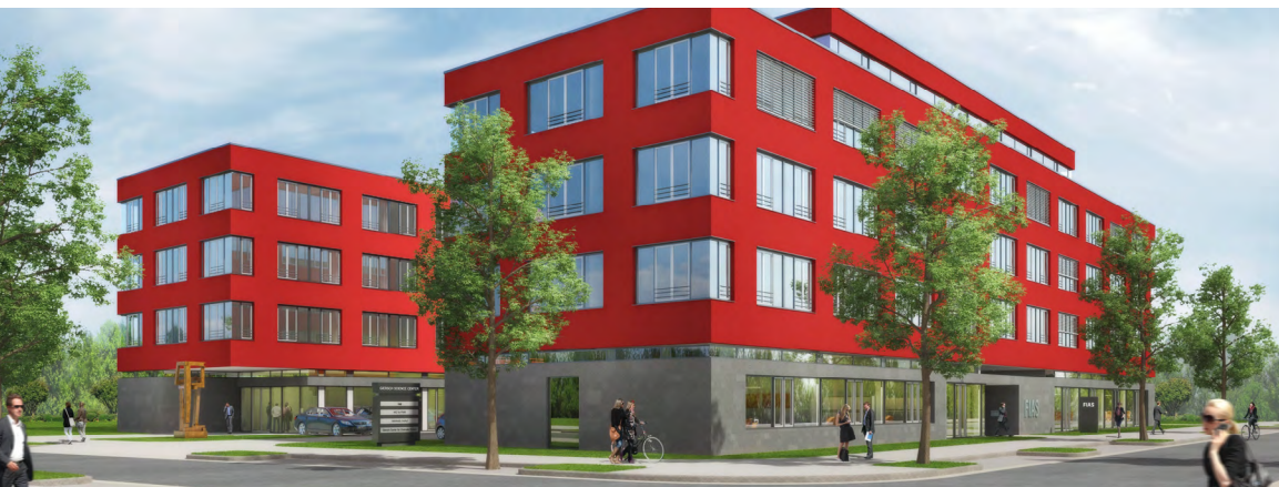
In dem strahlend roten Gebäude auf dem Campus Riedberg wird Materie erforscht. Links Giersch Science Center, rechts FIAS.

Neue Einblicke in die Struktur der Materie und die Evolution des Universums werden künftig auf dem Campus Riedberg gewonnen. Das im Mai eröffnete Giersch Science Center (GSC) ist neue Heimat für bis zu 250 Wissenschaftlerinnen und Wissenschaftler des Helmholtz Inter-