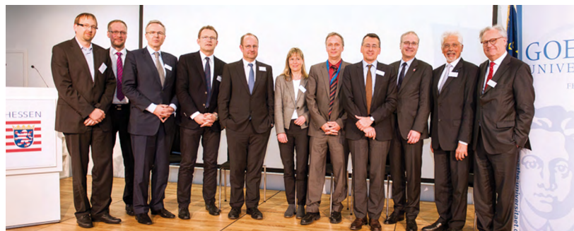
Am 8. April hat das Präsidium der Goethe-Universität in der Hessischen Landesvertretung ihre Brüsseler Repräsentanz eröffnet.

Dabei verfolgt die Goethe-Universität mit dem Büro in der Hessischen Landesvertretung nicht nur das Einbringen politischer Beratungskompetenz etwa in Fragen der Finanzmarkt- und Gesundheitsforschung, wie dies bereits auf hessischer Ebene mit der Policy Unit des House of Finance geschieht. Es geht ihr auch um einen besseren Zugang zu dem europäischen Programm Horizont 2020 , das über 70 Milliarden Euro in Wissenschaft und Forschung investieren will. „Eine Präsenz in Brüssel hilft uns, mehr dieser Mittel für die Goethe-Universität und damit für das Land Hessen zu mobilisieren. Als eine Universität, die Fra-